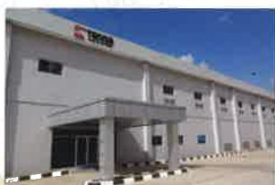
PT. TENMA INDONESIA スルヤチブタ工場 (①2016年8月 ②50,860㎡ ③27,477㎡ ④29,205㎡)