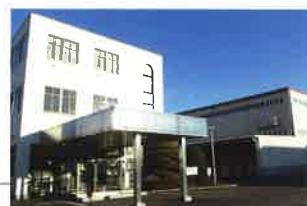
新白河工場 (①1985年10月 ②58,278㎡ ③31,780㎡ ④40,755㎡)