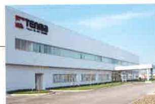
TENMA VIETNAM CO., LTD. (①2007年11月 ②99,338㎡ ③33,640㎡ ④39,322㎡)