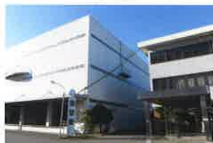
野田工場 (①1967年10月 ②31,684㎡ ③22,119㎡ ④38,054㎡)