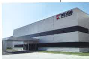
TENMA (HCM) VIETNAM CO., LTD. ノイバイ工場 (①2018年10月 ②44,888㎡ ③23,283㎡ ④25,695㎡)