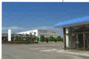
山口工場 (①1981年3月 ②36,211㎡ ③19,568㎡ ④23,360㎡)