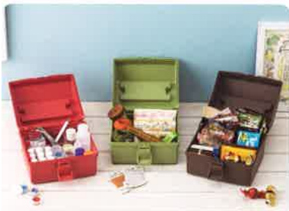
「ハコット」シリーズ