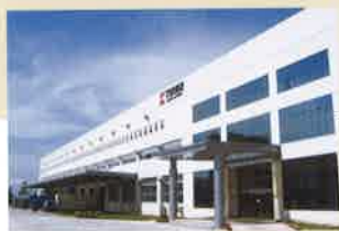
天馬精密工業(中山)有限公司 (①2005年12月 ②50,334㎡ ③19,425㎡ ④39,531㎡)