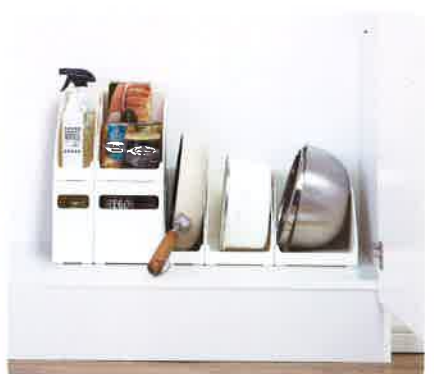
「ファビエ仕切るケース」シリーズ