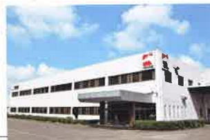
上海天馬精塑有限公司 (①1995年7月 ②39,039㎡ ③20,290㎡ ④36,059㎡)