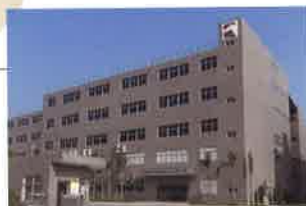
天馬精密注塑(深圳)有限公司 (①2005年12月 ②27,667㎡ ③15,763㎡ ④62,546㎡)