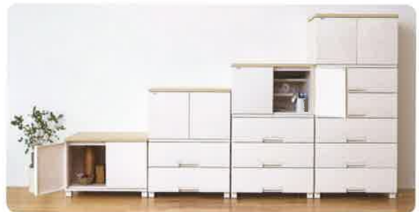
「フィツプラスキャビネット」シリーズ