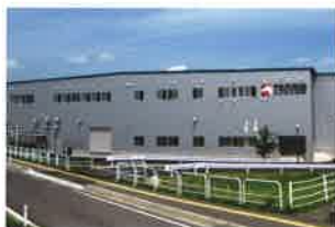
弘前工場 (①2009年7月 ②9,410㎡ ③5,626㎡ ④10,977㎡)