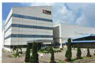
PT. TENMA INDONESIA スルヤチブタ工場 (①1991年12月 ②24,907㎡ ③17,568㎡ ④18,930㎡)