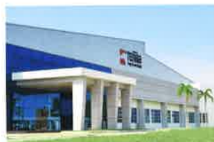
TENMA (THAILAND) CO., LTD. プラチンプリ工場 (①2014年1月 ②73,360㎡ ③25,500㎡ ④26,500㎡)