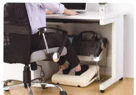
「フィツワーク」シリーズ