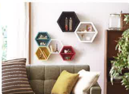
「モアプラス」シリーズ