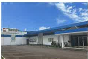
PT. TENMA INDONESIA チトゥン工場 (①1991年1月 ②31,765㎡ ③23,528㎡ ④25,839㎡)