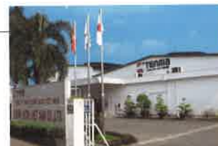
TENMA (HCM) VIETNAM CO., LTD. ホーチミン工場 (①1994年7月 ②35,000㎡ ③19,894㎡ ④19,894㎡)