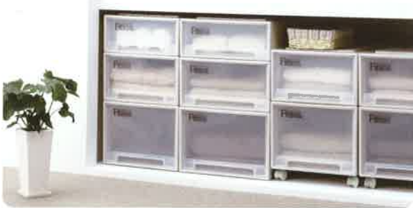
「フィツケース」シリーズ

1986年の発売以来、収納ケースの定番として広く浸透。高い基本性能と多彩なサイズ・デザイン展開が特長です。