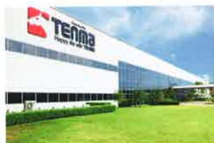
TENMA (THAILAND) CO., LTD. アマタシティ工場 (①2000年1月 ②125,000㎡ ③43,463㎡ ④47,559㎡)