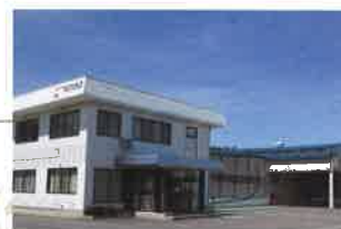
八戸工場 (①1991年10月 ②50,542㎡ ③10,577㎡ ④10,819㎡)