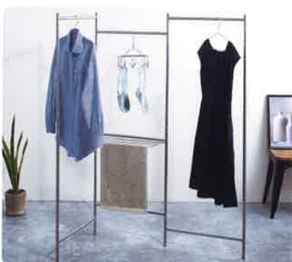
「インテリア物干し」シリーズ