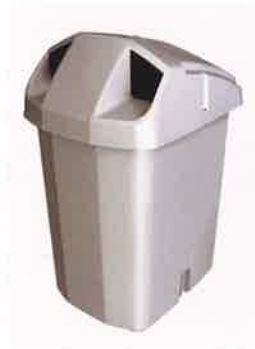
飲料用ダストボックス