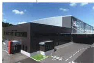
滋賀工場 (①1973年4月 ②109,415㎡ ③43,227㎡ ④53,368㎡)