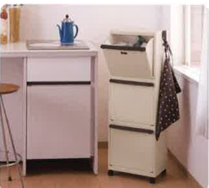
「イーラボホーム」シリーズ