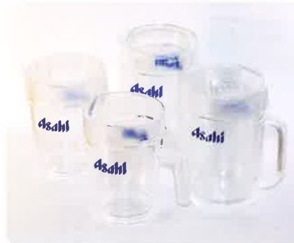
ビールピッチャー