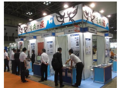
参考:モノづくりマッチングJapan 2018 青森県ブース