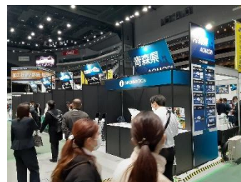
参考:彩の国ビジネスアリーナ2025 青森県ブース