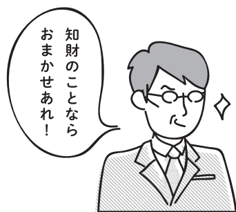
青森県知財総合支援窓口