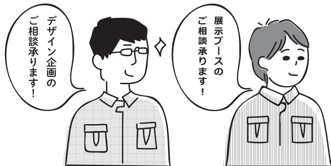
弘前工業研究所デザイン推進室