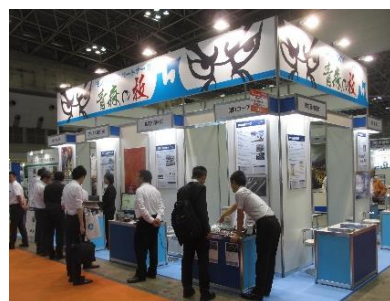
参考:モノづくりマッチングJapan 2018 青森県ブース