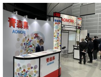
参考:彩の国ビジネスアリーナ2023 青森県ブース