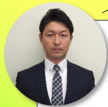
八戸サテライト担当