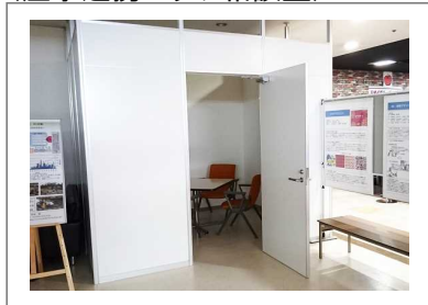
(産学連携プラザ相談室)

■相談予約・お問合せ 「青森県よろず支援拠点」(21あおもり産業総合支援センター内) 電話017-721-3787